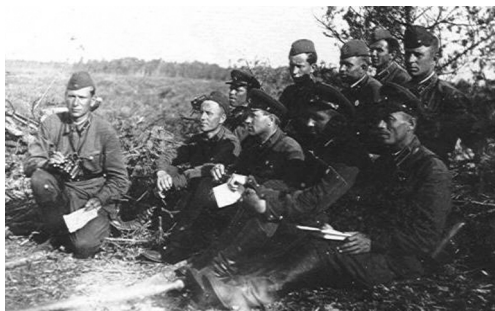
1942 год, Сергей Фёдорович на командном пункте дивизиона реактивной артиллерии

РС и на юго-западном направлении. К ноябрю на Западном и Калининском фронтах было 108 дивизионов (из них 47 М-30), на Юго-Западном, Донском, Сталинградском и Закавказском фронтах — 130 (в том числе 20 М-30).»