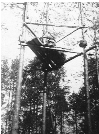
Наблюдательный пункт